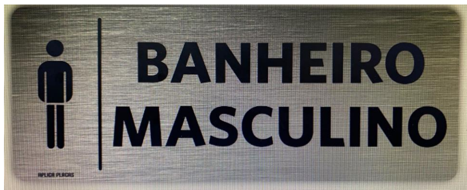
ESCRITO = 1 BANHEIRO MASCULINO 1 BANHEIRO FEMININO